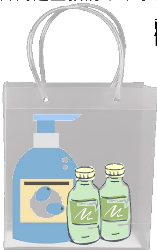
產品示意圖，非實際包裝